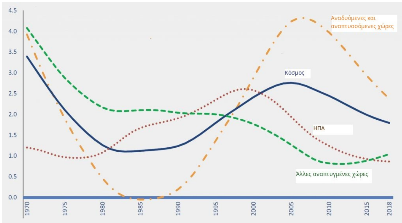
Γράφημα 1. Αύξηση της παραγωγικότητας της εργασίας

Αυτό κατέστη δυνατό μόνο μέσα από το σχεδόν καθολικό φρένο που μπήκε στους μισθούς, των οποίων το μερίδιο στο εισόδημα τείνει να μειώνεται. Και το αποτέλεσμα αυτό, με τη σειρά του, επιτεύχθηκε χάρη σε ένα σύνολο από διευθετήσεις που αλληλοενισχύονται (παγκοσμιοποίηση, χρηματοστηριοποίηση, τεχνολογικές ανακαινίσεις, χρέωση), των οποίων οι σχετικές συμβολές θα ήταν μάταιο να επιχειρηθεί να κατανεμηθούν επακριβώς. Οι ανισότητες αποτελούν αναπόσπαστο τμήμα του συνεκτικού αυτού μοντέλου, του οποίου όμως η συνοχή δεν θα μπορούσε να είναι μόνιμη 3 . Είναι ακριβώς οι αντιφάσεις του μοντέλου αυτού που οδήγησαν στην κρίση του 2007-2008. Η παγκοσμιοποίηση είναι ασφαλώς το ένα από τα ουσιαστικά στοιχεία του μοντέλου, αλλά η κρίση είχε για αποτέλεσμα να τροποποιήσει τα χαρακτηριστικά της.